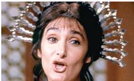
Anna Marchesini nella riduzione tivù de "I promessi sposi"