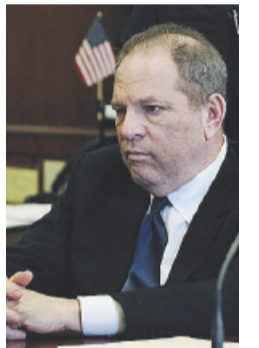
IN AULA H. Weinstein

In aula Weinstein si limita a poche parole, sì e no. È pallido. Non risponde alle domande urlate dai giornalisti fuori dal tribunale. Finita l'udienza lascia il tribunale e nel giro di pochi minuti rientra in auto e si allontana. L'ex produttore star è stato accusato complessivamente da oltre 70 donne di molestie: accuse che hanno dato vita al movimento #MeToo.