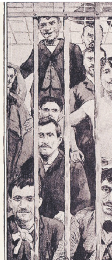
DOCUMENTI STRAORDINARI Imputati al processo del 1891 contro la mala barese e il fazzoletto con la canzone